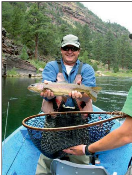
Cat Bowl Trout di ca. 50 cm

rilasciano il pescato nell'ordine del 95% !